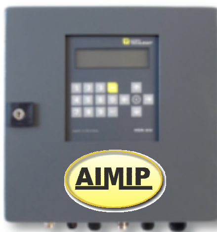
Automate HDA 5 eco, jusqu'à 5 pompes : AI110 500 800

Sécuriser et gérer sur P.C. la consommation des véhicules d'une flotte